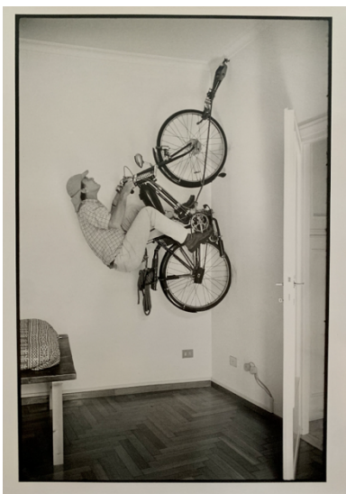
Leonard Freed (estadounidense, 1929-2006) Sin título, Roma, Italia, 2001 Impresión en gelatina de plata, 14 x 11 pulgadas.

Esta imagen habla de la basculación cultural de Francia entre el presente y el pasado, yuxtaponiendo bicicletas contemporáneas y cuatro mujeres británicas con trajes tradicionales que datan del siglo XIX . Todo lo que visten estas mujeres es un símbolo de sus orígenes sociales y geográficos. Lo más destacable es su peinado. bigoudène : tocados cilíndricos de encaje almidonado que miden entre 30 y 40 centímetros de alto. Los usan las mujeres de la zona de Bigouden , en la costa suroeste de Finisterre .