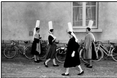
Elliott Erwitt (estadounidense nacido en Francia, n. 1928) Bretaña, Francia, 1960 Impresión en gelatina de plata, 11 x 14 pulgadas.

Nacido en París de padres rusos, Elliot Erwitt pasó su infancia en Milán antes de emigrar a los Estados Unidos en 1939. En 1951, fue reclutado y sirvió en el Cuerpo de Señales del Ejército en Alemania y Francia. Al regresar a Nueva York, inició una exitosa carrera independiente. Sus fotografías periodísticas, comerciales y personales utilizaron el humor y la ironía para mostrar emociones humanas sinceras y explorar las paradojas de la vida. Esta es una de sus fotografías más icónicas. Con boinas y baguettes, fue utilizado por la Oficina de Turismo de Francia para ilustrar el arte de vivir del país.