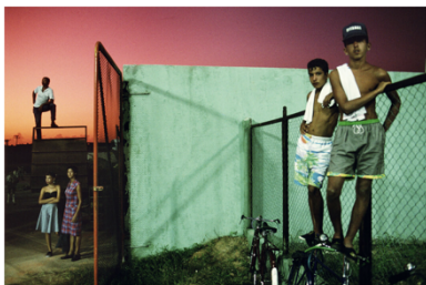
Alex Webb (estadounidense, n. 1952) Sancti Spiritus, Cuba, 1993 Impresión Cibachrome, 30 x 40 pulgadas.

Ron Turner se mudó a City Island en el Bronx en 1974. Abrió una galería y se sumergió en la comunidad. City Island es inusual: una escapada tranquila y pintoresca junto al mar dentro de las fronteras de la ciudad de Nueva York. Turner ha documentado los cambios de su vecindario a lo largo de décadas. En un cálido día de verano, esta chica descalza está sentada en su bicicleta absorta en una conversación por un teléfono público. El acto de hablar por teléfono público, su ropa y su peinado fechan esta imagen en la década de 1980, pero su elegancia y sensualidad relajada e inconsciente son atemporales.