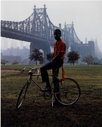
Evelyn Hofer (estadounidense nacida en Alemania, 1922-2009) Puente de Queensboro, Nueva York, 1964 Impresión por transferencia de tinte, 20 x 16 pulgadas

evelyn Hofer creó una obra que recordaba la tradición del fotógrafo alemán August Sander y anticipaba el trabajo en color del fotógrafo estadounidense William Eggleston, lo que hizo que el crítico de arte Hilton del New York Times la llamara "la fotógrafa desconocida más famosa de Estados Unidos". Kramer. Trabajando con una incómoda cámara con visor de 4 x 5 pulgadas, Hofer fotografió a sus sujetos donde los encontró, pero buscó cuidadosamente capturar su individualidad.