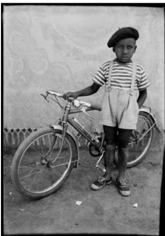
Seydou Keïta (Maliense, 1921/1923-2001) Retrato sin título , c.1950 Impresión en gelatina de plata (ed. de 10), 23 ½ x 19 ½ in Galería James Danziger, Nueva York

Entre 1965 y 1966, Evelyn Hofer recibió el encargo de la editorial Harper & Row de realizar una serie de fotografías en la ciudad de Dublín. Sus imágenes acompañaron un texto de VS Pritchett, el novelista, crítico y escritor de viajes británico. Para este proyecto, Hofer se centró en las personas que constituían la esencia de la ciudad. Realizó numerosos retratos de escritores, poetas y personajes públicos, así como de personas desconocidas en la calle y de niños jugando. Sus imágenes son un testimonio de su compromiso respetuoso con sus sujetos, quienes participaron como socios iguales en el proceso de creación de estas imágenes.