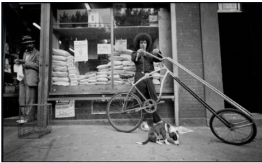
Susan Meiselas (estadounidense, n. 1948) Bodega en Mulberry Street, Little Italy, Nueva York, 1975 Impresión en gelatina de plata, 16 x 20 pulgadas. Cortesía del artista

Durante más de cinco décadas, Steve McCurry ha trabajado como fotoperiodista, cubriendo guerras y pobreza en todo el mundo. Comenzó a fotografiar en el subcontinente indio en 1978. Esta es una foto clásica de McCurry, que ilustra con sus característicos colores saturados una imagen cotidiana que también es un momento muy preciso. Las cuatro ventanas del vagón del tren enmarcan cuatro retratos de personas, mostrando el vagón abarrotado y el ingenio de los viajeros para colgar las dos bicicletas en el exterior del tren. Las cuatro ruedas de la bicicleta hacen eco de las cuatro ventanas.