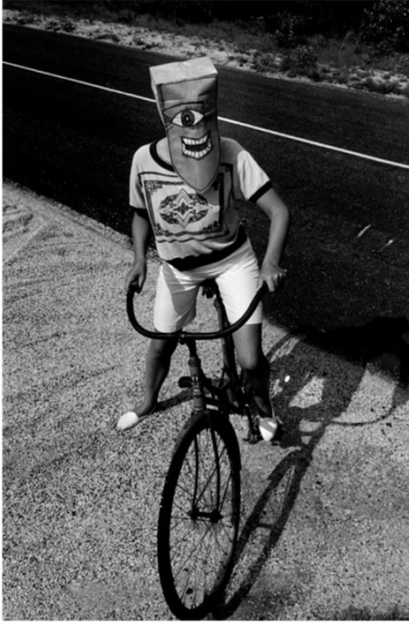
Inge Morath (austriaca, 1923-2002) Sin título, EE. UU. (de la serie Mask con Saul Steinberg), 1962 Impresión pigmentada de archivo, 11 x 17 pulgadas Máscara de Saul Steinberg

Inge Morath creció en una Europa devastada por la guerra. En 1951, comenzó a fotografiar y cuatro años más tarde, fue una de las pocas fotógrafas que se unió a la agencia Magnum. Serenas pero llenas de energía, las fotografías de Morath mostraban a personas comunes y corrientes, así como a personas famosas que conoció en sus numerosas asignaciones internacionales. En 1956 conoció al dibujante Saul Steinberg. Hasta 1962, colaboraron en la Serie de Máscaras : retratos de personas con máscaras de cajas de cartón o bolsas de papel creadas por Steinberg y fotografiadas por Morath.