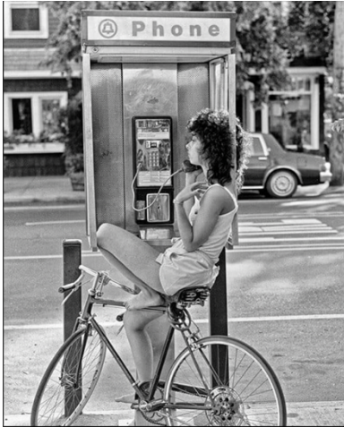
Ron Turner (estadounidense, n. 1949) Chica en bicicleta, City Island, Bronx, Nueva York, 1980 Impresión pigmentada, 13 x 19 pulgadas

Ron Turner se mudó a City Island en el Bronx en 1974. Abrió una galería y se sumergió en la comunidad. City Island es inusual: una escapada tranquila y pintoresca junto al mar dentro de las fronteras de la ciudad de Nueva York. Turner ha documentado los cambios de su vecindario a lo largo de décadas. En un cálido día de verano, esta chica descalza está sentada en su bicicleta absorta en una conversación por un teléfono público. El acto de hablar por teléfono público, su ropa y su peinado fechan esta imagen en la década de 1980, pero su elegancia y sensualidad relajada e inconsciente son atemporales.