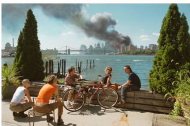
Thomas Hoepker (alemán, n. 1936) Brooklyn, Nueva York, 11 de septiembre de 2001, impreso en 2019 Impresión por inyección de tinta, 44 x 65 pulgadas

Jim Goldberg es parte de un movimiento documental experimental en fotografía que se basó en presentaciones sencillas de una imagen y la capacidad del medio para contar historias. Trabajando en series, sus proyectos reflejan colaboraciones profundas y a largo plazo con poblaciones desatendidas, ignoradas o fuera de la corriente principal. En 2004, Goldberg se embarcó en su proyecto Open See que se publicó en 2009. Incluyendo a menudo las propias palabras de su sujeto, exploraba la experiencia de los "nuevos europeos", inmigrantes que abandonaron países devastados por la guerra o económicamente en dificultades para hacer una nueva vida en Europa.