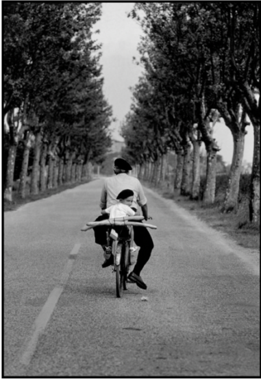
Elliott Erwitt (estadounidense nacido en Francia, n. 1928) Provenza, Francia, 1955 Impresión en gelatina de plata, 24 x 20 pulgadas.

Nacido en París de padres rusos, Elliot Erwitt pasó su infancia en Milán antes de emigrar a los Estados Unidos en 1939. En 1951, fue reclutado y sirvió en el Cuerpo de Señales del Ejército en Alemania y Francia. Al regresar a Nueva York, inició una exitosa carrera independiente. Sus fotografías periodísticas, comerciales y personales utilizaron el humor y la ironía para mostrar emociones humanas sinceras y explorar las paradojas de la vida. Esta es una de sus fotografías más icónicas. Con boinas y baguettes, fue utilizado por la Oficina de Turismo de Francia para ilustrar el arte de vivir del país.