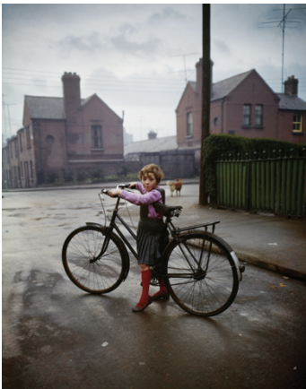
Evelyn Hofer (estadounidense nacida en Alemania, 1922-2009) Chica con bicicleta, Dublín, 1966 Impresión por transferencia de tinte, 20 x 16 pulgadas

evelyn Hofer creó una obra que recordaba la tradición del fotógrafo alemán August Sander y anticipaba el trabajo en color del fotógrafo estadounidense William Eggleston, lo que hizo que el crítico de arte Hilton del New York Times la llamara "la fotógrafa desconocida más famosa de Estados Unidos". Kramer. Trabajando con una incómoda cámara con visor de 4 x 5 pulgadas, Hofer fotografió a sus sujetos donde los encontró, pero buscó cuidadosamente capturar su individualidad.