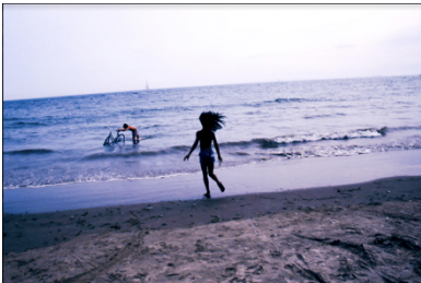
Philippe Cheng (estadounidense, n. 1961) Sin título, Coney Island, Nueva York, 1994 Impresión cromogénica montada sobre Dibond con UV Plexi, 30 x 45 in Cortesía del artista

Henri Cartier-Bresson fue pionero en el género de la fotografía callejera, fue un maestro de la toma espontánea y fue uno de los primeros en utilizar películas de 35 mm. Su enfoque estricto implicó componer cada fotografía dentro del visor de la cámara y nunca recortar una imagen para imprimirla. Quería capturar lo que llamó el " momento decisivo ", que definió como "el reconocimiento simultáneo, en una fracción de segundo, del significado de un evento así como de una organización precisa de las formas que le dan a ese evento su significado propio". expresión.' Esto se ve en esta imagen con su composición formal de la escalera y el ciclista borroso corriendo a toda velocidad a través del encuadre.