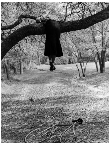
Bruce Weber (estadounidense, n. 1946) Sin título, 1984 Impresión en gelatina de plata, 24 x 20 pulgadas.

Inspirado por América Latina y el Caribe, Alex Webb pasó a la fotografía en color en 1979 y es reconocido por sus imágenes complejas y vibrantes de momentos fortuitos o enigmáticos en medio de la agitación sociopolítica. Esta fotografía es de su libro con Rebecca Norris Webb, Violet Isle: A Duet of Photographs from Cuba . Comenzó como dos proyectos separados: la exploración de Alex de las calles cubanas y el descubrimiento de Rebecca de las numerosas y únicas colecciones de animales de la isla. Sin embargo, se dieron cuenta de que su trabajo surgía de la misma noción: la sensación de una nación en una burbuja económica, política, cultural y ecológica.