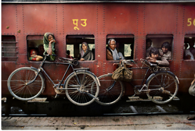
Steve McCurry (Americano, nacido en 1950) De Dacca a Peshawar, Bengala Occidental, India, 1983 Impresión pigmentada de archivo, 30 x 40 pulgadas Cortesía del artista

Durante más de cinco décadas, Steve McCurry ha trabajado como fotoperiodista, cubriendo guerras y pobreza en todo el mundo. Comenzó a fotografiar en el subcontinente indio en 1978. Esta es una foto clásica de McCurry, que ilustra con sus característicos colores saturados una imagen cotidiana que también es un momento muy preciso. Las cuatro ventanas del vagón del tren enmarcan cuatro retratos de personas, mostrando el vagón abarrotado y el ingenio de los viajeros para colgar las dos bicicletas en el exterior del tren. Las cuatro ruedas de la bicicleta hacen eco de las cuatro ventanas.