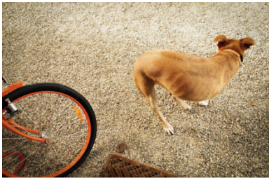
Lindsay Morris (estadounidense, n. 1966) El perro de tres patas de Jon Robin Baitz , East Hampton, Nueva York , 2009 Impresión pigmentada de archivo, 23 x 34 pulgadas Cortesía del artista

Inge Morath creció en una Europa devastada por la guerra. En 1951, comenzó a fotografiar y cuatro años más tarde, fue una de las pocas fotógrafas que se unió a la agencia Magnum. Serenas pero llenas de energía, las fotografías de Morath mostraban a personas comunes y corrientes, así como a personas famosas que conoció en sus numerosas asignaciones internacionales. En 1956 conoció al dibujante Saul Steinberg. Hasta 1962, colaboraron en la Serie de Máscaras : retratos de personas con máscaras de cajas de cartón o bolsas de papel creadas por Steinberg y fotografiadas por Morath.